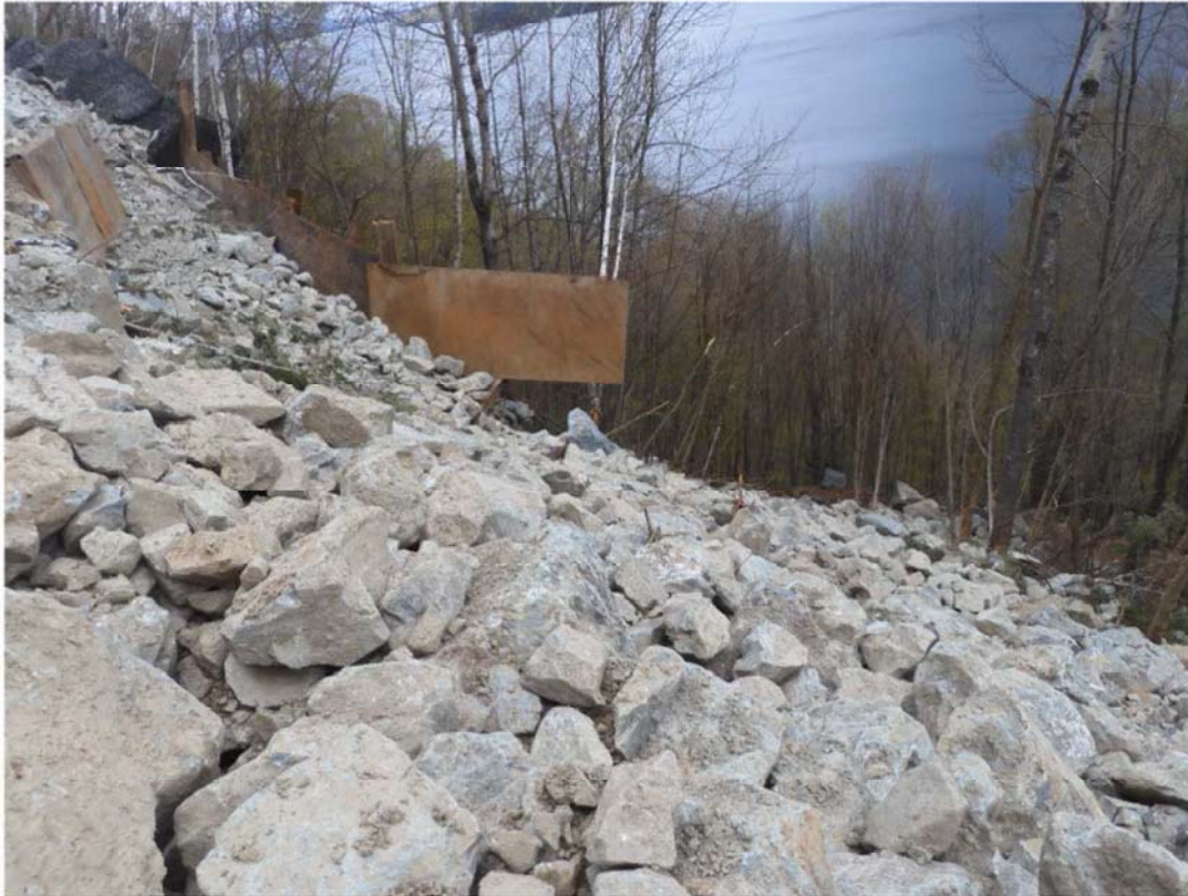
Photo 3 : Structures de soutènement (palplanches et poutre en « H ») ayant cédé à la suite de l'impact lors de l'éboulement du 4 mai 2021.

Je questionne M. F. [REDACTED] afin de savoir si les structures de soutènement sont installées selon le plan et devis d'un ingénieur. M. F. [REDACTED] me confirme que non et m'indique que ces structures ont été installées comme mesure de protection supplémentaire et non comme un soutènement. J'informe M. F. [REDACTED] et puisque ces structures retiennent présentement des roches, elles agissent comme une mesure de soutènement. Une attestation d'ingénieur devra donc être obtenue afin de s'assurer de la stabilité des installations ainsi que de leur capacité à supporter les charges auxquelles elles sont soumises (voir rapport de décision remis sur place RAP9143334).