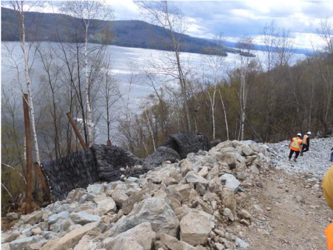
Photo 2 : Poutre en « H » et pare-éclats installés en aval du chemin temporaire.