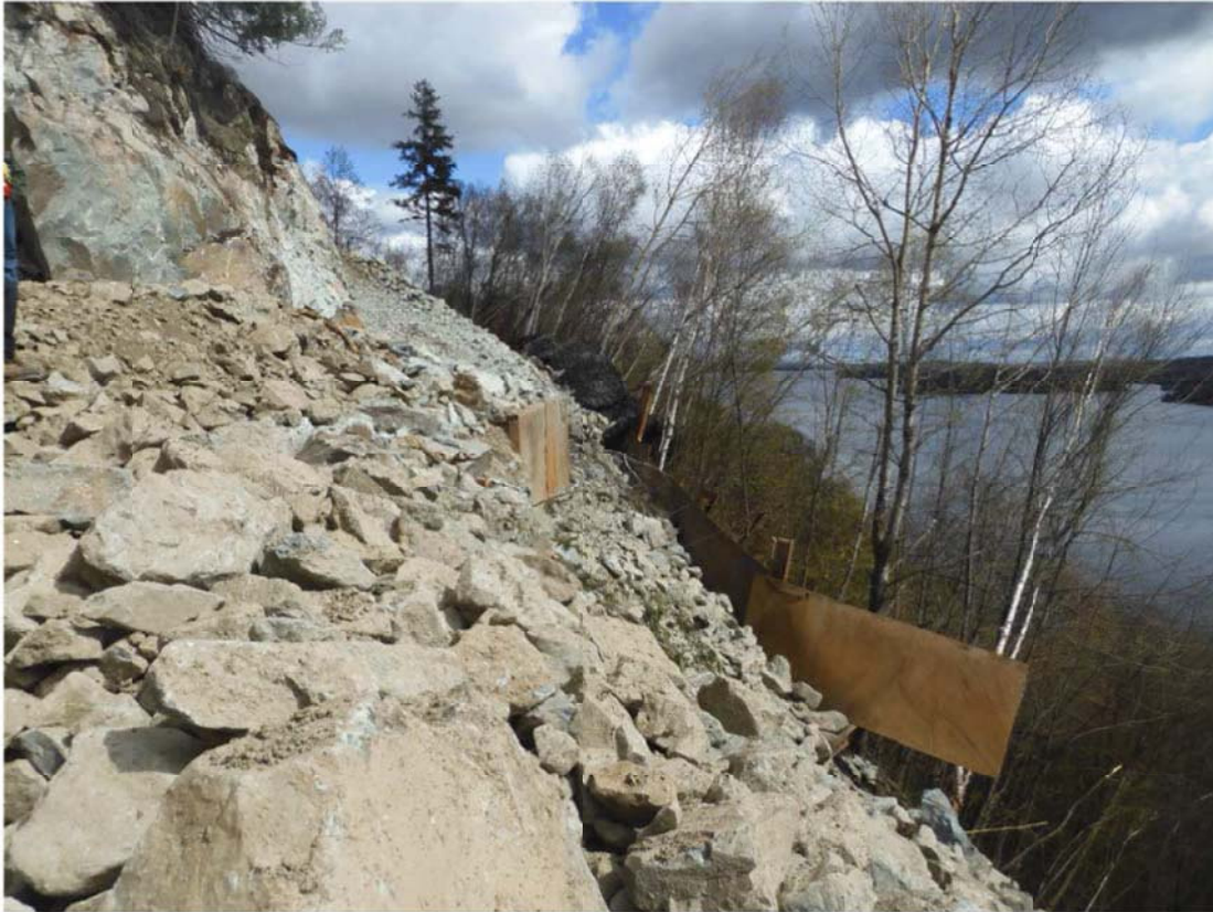
Photo 1 : Installation des structures de soutènement (palplanches, poutres en « H », boîtes de tranchées et pare-éclats).